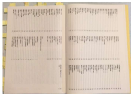
「この道ひとすじ」の目次ページの一部